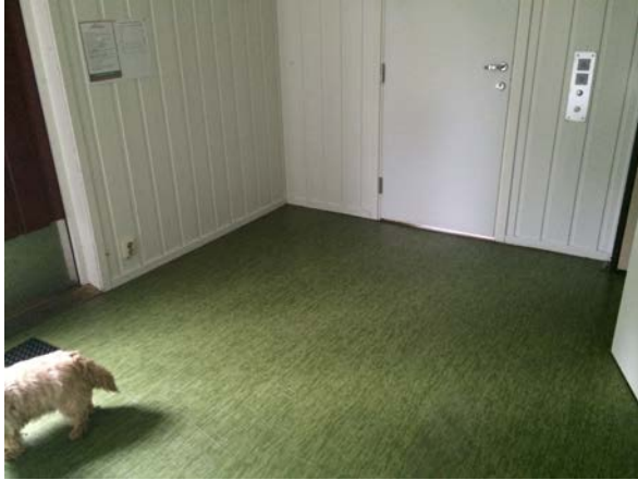
Ingen møbler i gangen (hunden hører ikke til Allhuset)