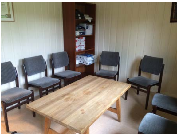
Møterom / Pauserom